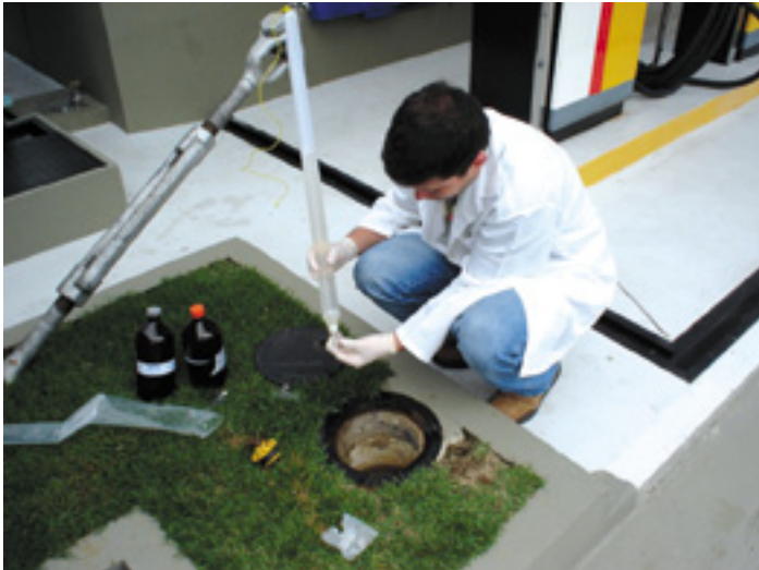
Monitoramento para a garantia da qualidade de águas subterrâneas, realizado no posto de combustível da Marinas Nacionais.

A Marinas Nacionais está concluindo os estudos e análises necessárias para a licença ambiental com vistas ao desassoreamento da bacia de ancoragem das embarcações.